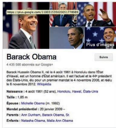
Doc. 2 : Infobox Wikipédia sur « Obama » en juillet 2014.

Le principe de la mesure d'audience a quant à lui contaminé le modèle du Web social, à travers la multiplication d'outils permettant de surveiller ses propres scores. Menée dans un registre semi-public, la conversation sert alors, en même temps, à maintenir sa popularité.